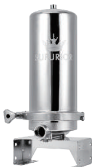
SR-1410HSS 全戶式除氯抑垢濾淨組